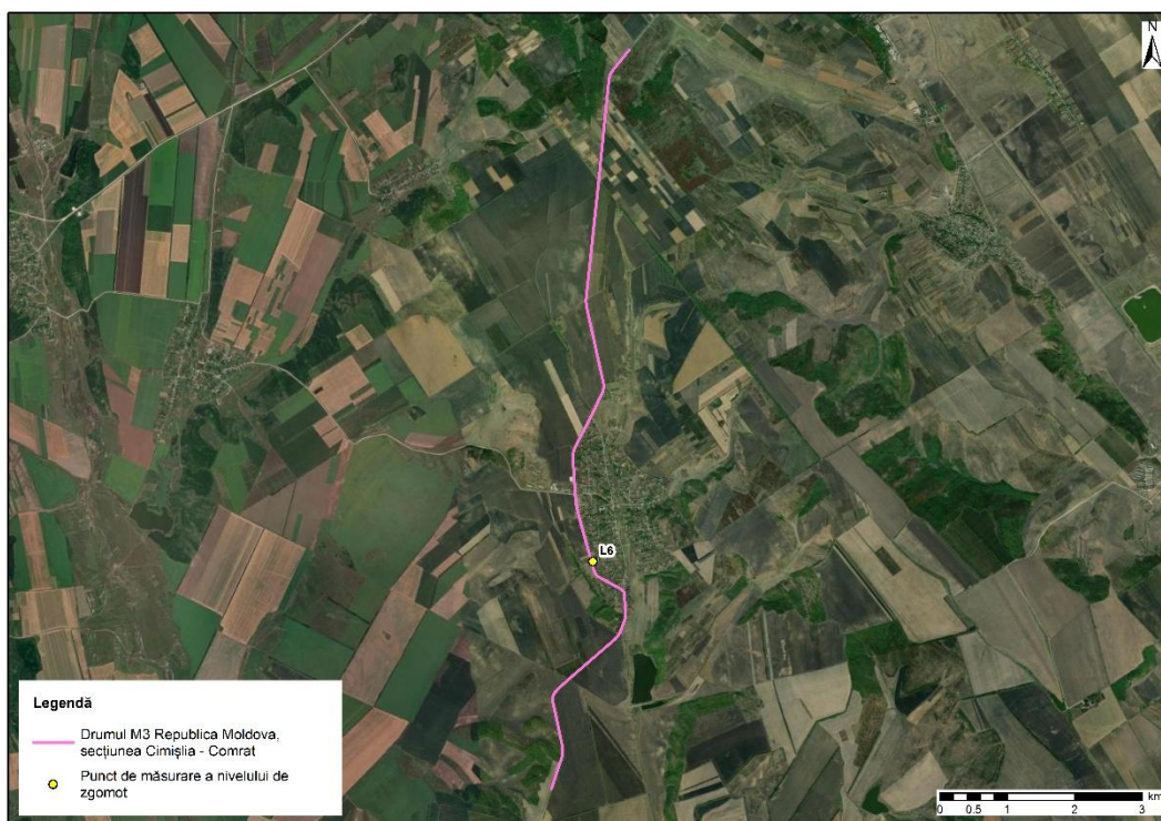
Figura 1 – Amplasarea punctelor de măsurare a nivelurilor de zgomot ambiental utilizate pentru caracterizarea situației acustice existente

Localizarea punctelor de măsurare este prezentată în Figura 1, iar valorile nivelurilor de zgomot determinate sunt sintetizate în Tabelul 1. În tabel sunt prezentate și valorile incertitudinii de măsurare asociate determinărilor acustice.